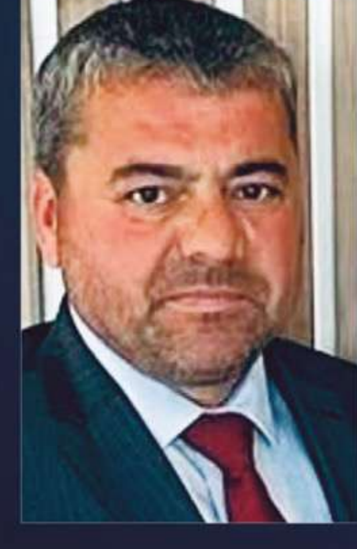
NESRİ HACI MHP Büyükşehir Belediye Başkanı