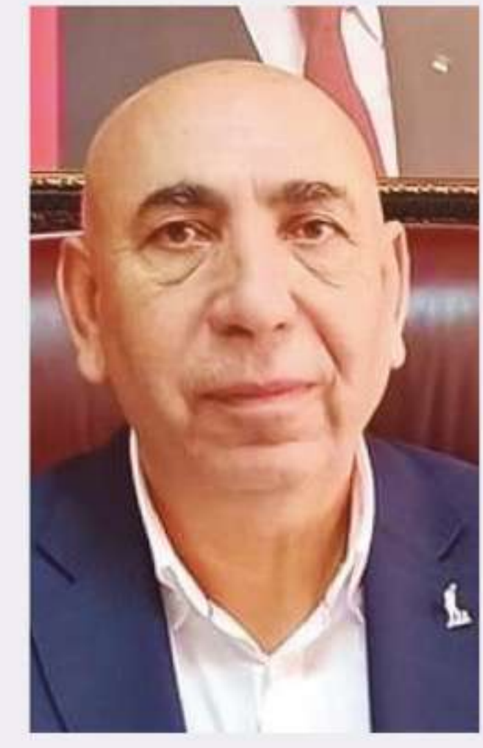
HALİS ÇİÇEKÇİ CHP Büyükşehir Belediye Başkanı